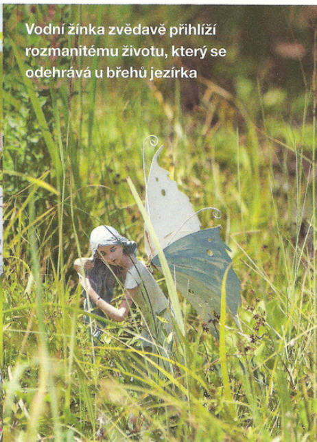
Vodní žínka zvědavě přihlíží rozmanitému životu, který se odehrává u břehů jezírka